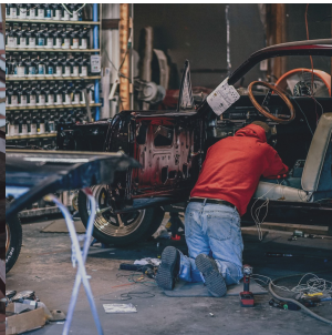
Гаражные, дачные, мастерские работы