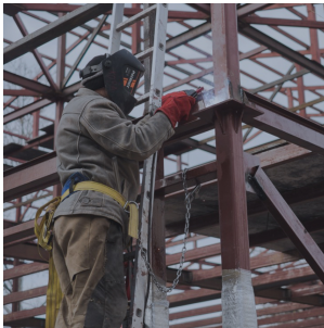
Строительство, монтаж металлоконструкции