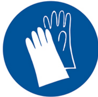
РАБОТАТЬ В ЗАЩИТНЫХ ПЕРЧАТКАХ (РУКАВИЦАХ)