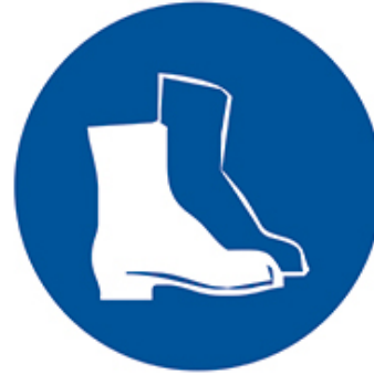
РАБОТАТЬ В ЗАЩИТНОЙ ОБУВИ

Аппарат воздушно-плазменной резки HUGONG POWER CUT 70 HF III разработан и изготовлен по инверторной технологии на базе новейших IGBT транзисторов, благодаря чему имеет высокие показатели по КПД преобразования электрической энергии, малый вес и высокую надежность.