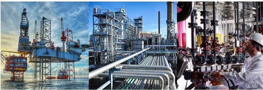
Нефтегазодобывающ ая промышленность