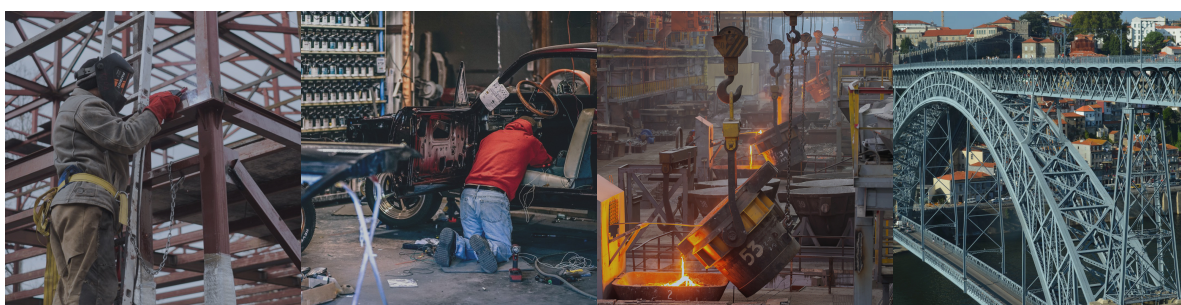
Строительство, монтаж металлоконструкции