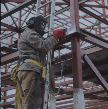
Строительство, монтаж металлоконструкции