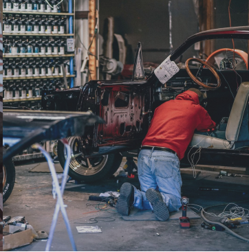
Гаражные, дачные, мастерские работы