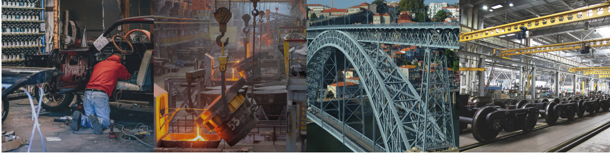
Гаражные, дачные, мастерские работы