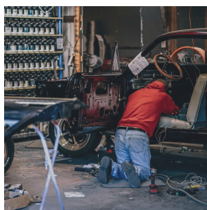
Гаражные, дачные, мастерские работы