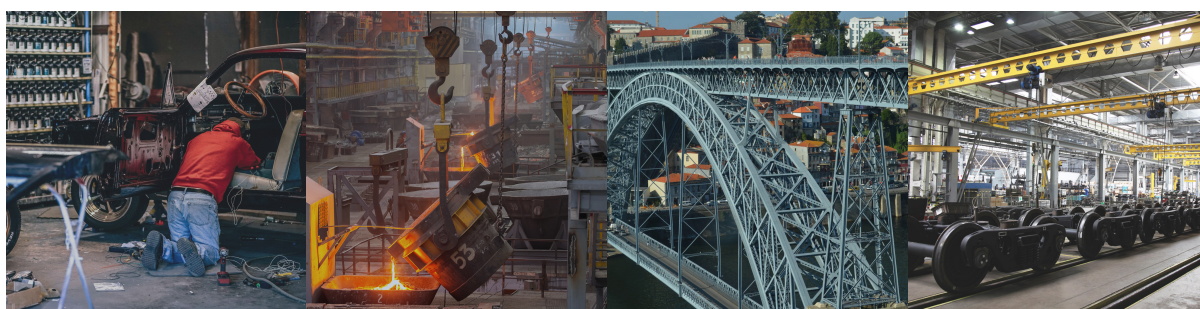
Гаражные, дачные, мастерские работы