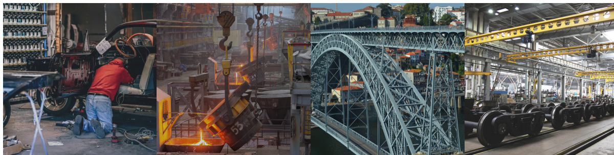
Гаражные, дачные, мастерские работы