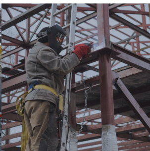
Строительство, монтаж металлоконструкции